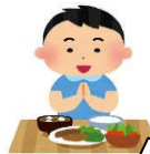
暖かい食事をとる!